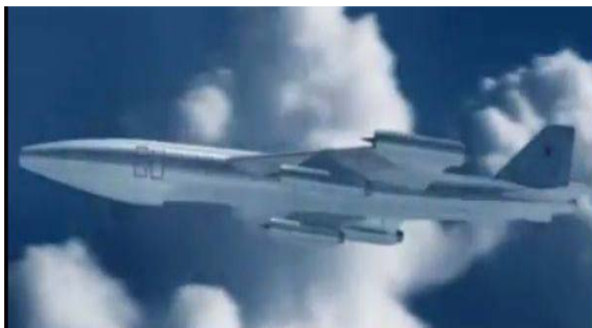
Рис. 4. Самолет М-60

Первым в СССР самолетом с атомным двигателем должен был стать бомбардировщик М-60 (рис. 4), разрабатываемый на основе существующего М-50.