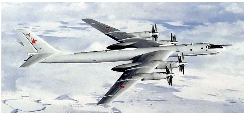
Рис. 6. Экспериментальный атомолет Ту-95ЛАЛ

Самолет Ту-95ЛАЛ (рис. 6) с работающим ядерным реактором на борту в 1961 году совершил серию летных испытаний с работающим реактором. Изучалось управление реактором в полете и эффективность биологической защиты. Выполнялись полеты как с горячим, так и с холодным реактором. Испытания Ту-95ЛАЛ показали высокую эффективность примененной системы радиационной защиты, но при этом она была громоздка, имела большой вес и требовала дальнейшего совершенствования. А главной опасностью атомного самолета была признана возможность его аварии и заражения больших пространств ядерными компонентами [5].