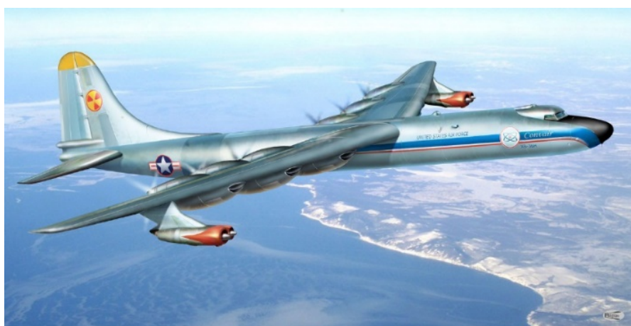
Рис. 3. Самолет-лаборатория Convair NB-36H

В ходе проведенных исследований предпочтение было отдано самолету B-36 Peacemaker.