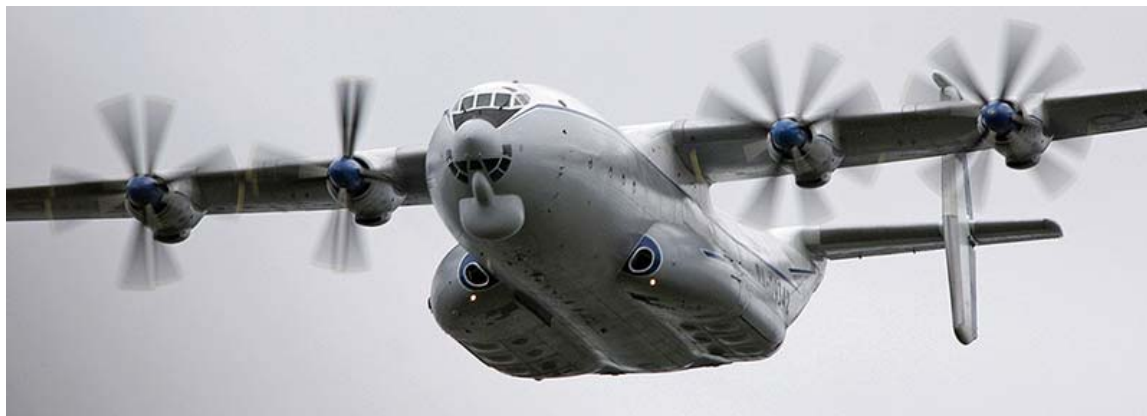
Рис. 7. Самолет АН-22ПЛО

ного излучения и многослойной защитной перегородкой. Позже на самолете установили небольшой атомный реактор в свинцовой оболочке. В 1970 году АН-22 (рис. 7) с новым ядерным реактором совершил 23 полета.