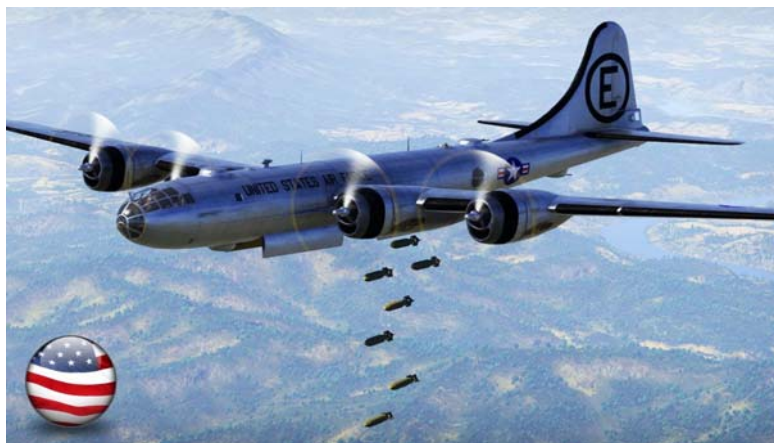
Рис. 1. Самолет В-29

Полет самолета В-29 (рис. 1), в бомбоотсеке которого находилась капсула с радиом, позволил конструкторам сделать вывод, что реальная масса реактора и защиты будут велики. Они смогли выделить ключевые вопросы, такие как: