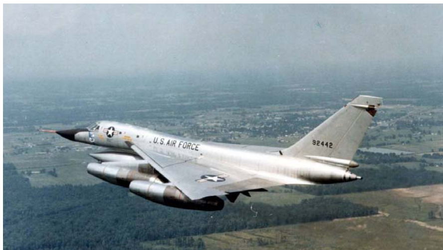
Рис. 2. Самолет B-58 Hustler

В ходе проведенных исследований предпочтение было отдано самолету B-36 Peacemaker.